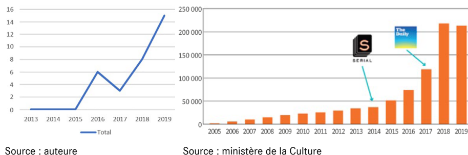
Figure 2 - Nombre annuel de podcasts recensés dans l'ensemble des bulletins (gauche) et offre annuelle de podcasts (tous sujets confondus) comptabilisée par le ministère de la Culture (droite)

Le suivi du contenu du bulletin de veille, de 2012 à 2020, atteste de la diversification des formats et supports des productions éditorialisées. Par exemple, le format audio y apparaît pour la première fois en 2015 et connaît ensuite une progression continue, qui témoigne de la montée du podcast comme format de diffusion (figure 2). Ceci découle